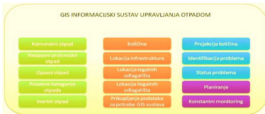
Slika 1. Struktura podataka u sklopu informacionog sisema upravljanja otpadom 18

Informacioni sustav upravljanja otpadom će biti zasnovan na GIS platformi 17 koja omogućava prostorno definiranje podataka, dajući kompletnu informaciju o integralnom sustavu upravljanja otpadom (informacije o količinama otpada, infrastrukturi, legalnim i nekontroliranim odlagalištima, shemama prikupljanja otpada i sl.).