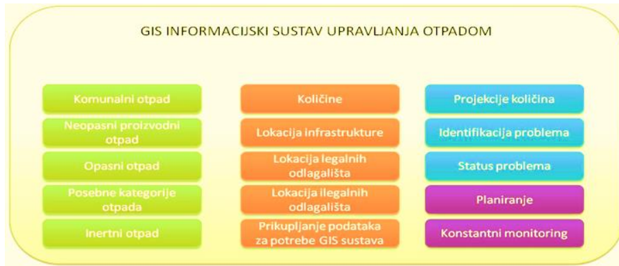
Slika 1. Struktura podataka u sklopu informacionog sistema upravljanja otpadom 18

Informacioni sistem upravljanja otpadom će biti zasnovan na GIS platformi 17 koja omogućava prostorno definisanje podataka, dajući kompletnu informaciju o integralnom sistemu upravljanja otpadom (informacije o količinama otpada, infrastrukturi, legalnim i nekontroliranim odlagalištima, shemama prikupljanja otpada i sl.).