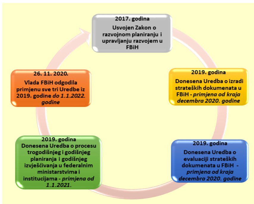
Dijagram 2. Donošenje propisa relevantnih za oblast strateškog planiranja